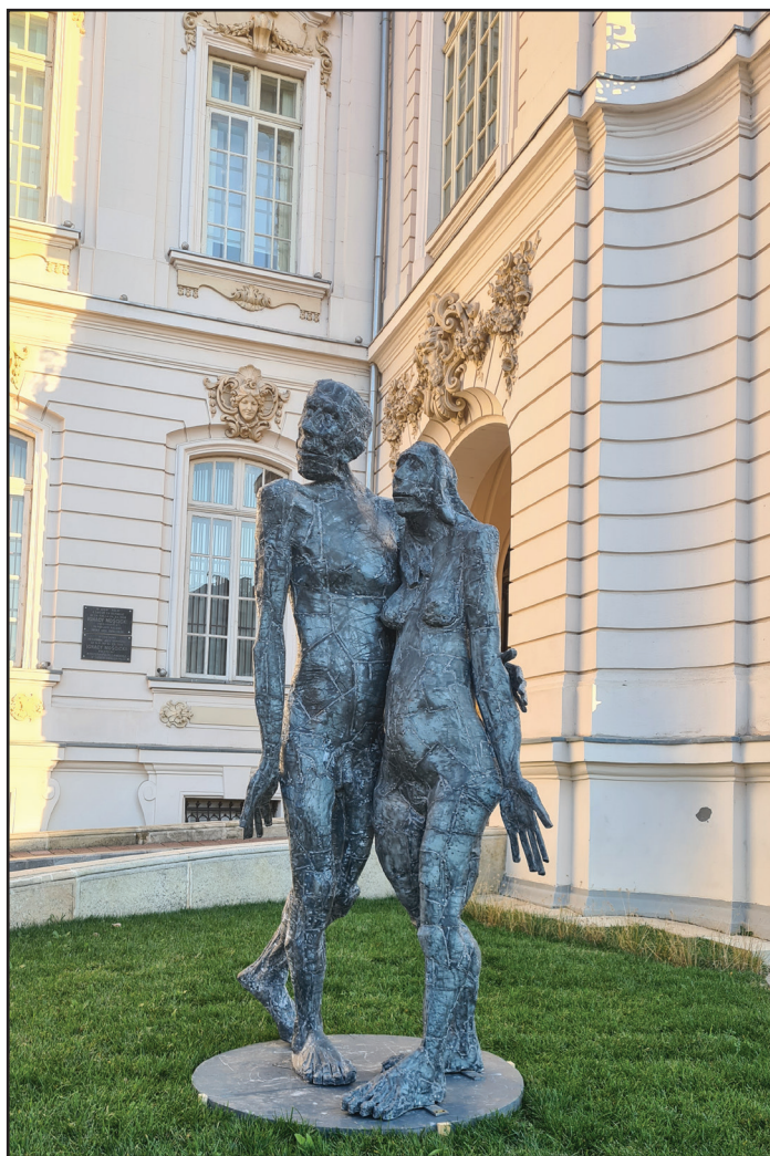
Aurel Vlad - Adam și Eva, 2018

Revistă de cultură fondată la Craiova, în 1927, serie nouă, din ianuarie 2003 Publicată de Scrisul Românesc Fundația-Editura, recunoscută CNCS